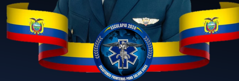
Mayor EDWIN FERNANDO AYALA TIPANTUÑA Especialista Especialista en Medicina Aeroespacial de la Fuerza Aérea Ecuatoriana Máster en Ciencia de Datos