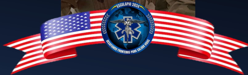
MAJ LISA ANGOTTI Trauma/Critical Care Trained Surgeon United States Air Force USAF